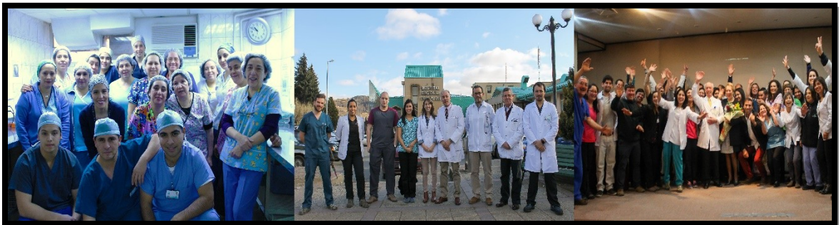
De izquierda a derecha: Equipo Unidad de Esterilización; nuevos especialistas médicos 2018; equipo Servicio Dental.