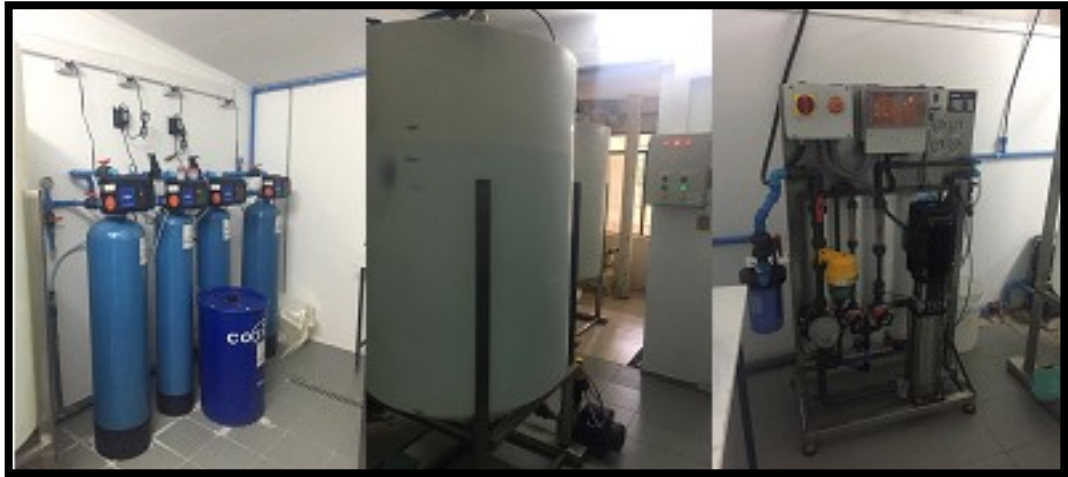
Nuevo equipamiento Esterilización.