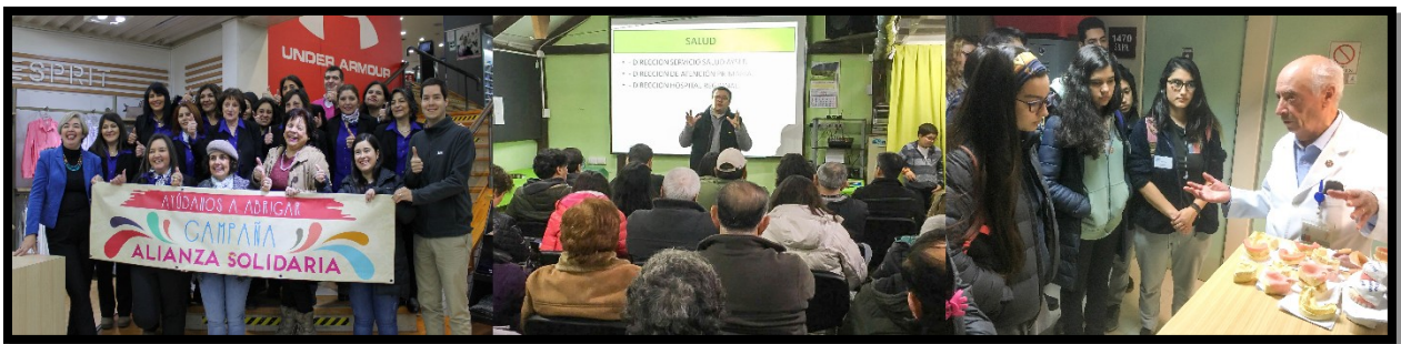
Charlas en junta de vecinos y colegios, visitas guiadas y campañas solidarias, han sido parte de las iniciativas de Participación Ciudadana 2018.